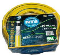
Vannslange 25-50 meter