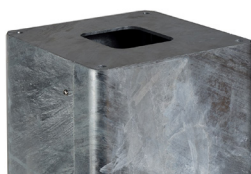
Forlenger – 50 cm