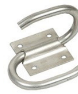
Kabelholder for å beskytte pluggen