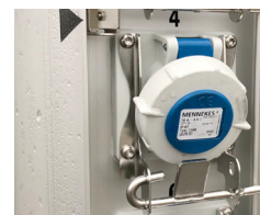
Låsebrakett for strømuttak