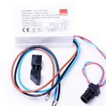
Skumringsrelé (automatisk på/av)