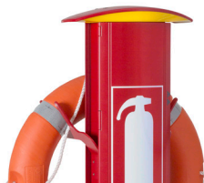
T6 SOS søyle