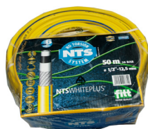
Vannslange 25-50 meter