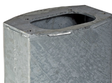
Forlenger – 50 cm