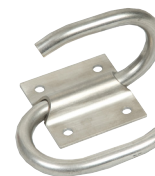
Kabelholder for å beskytte pluggen